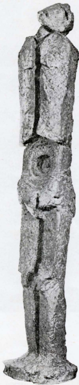
ROSA VICUÑA PREMIO DE ESCULTURA