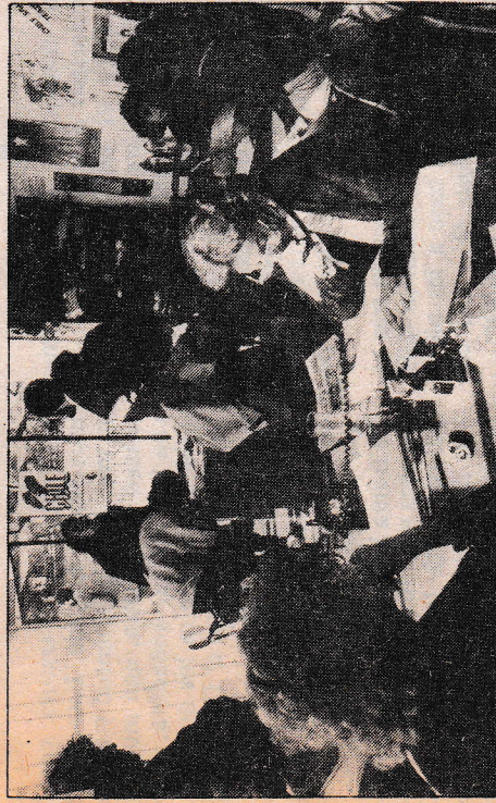
Oficina de Huérfanos: pocos teléfonos y pocas líneas.